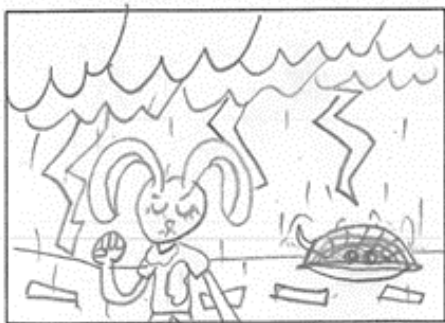
用「行為句」創作故事的「結局」

小白兔和小烏龜努力地跑着，小白兔在前邊跑，小烏龜在後面努力追趕。這時，天空下雨了。