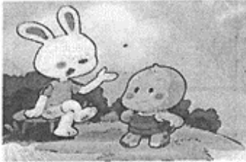
簡述事件內容 (時間+地點+人物+事情)